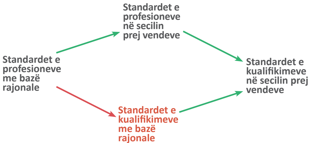
Diagrami 1: Kudri metodologjik për zhvillimin e standardeve të kualifikimeve me bazë rajonale

Metodologjia përshkruan procedurën që përbëhet nga katër hapa si dhe hapin pasues në procesin e zhvillimit të standardeve të kualifikimeve me bazë rajonale.